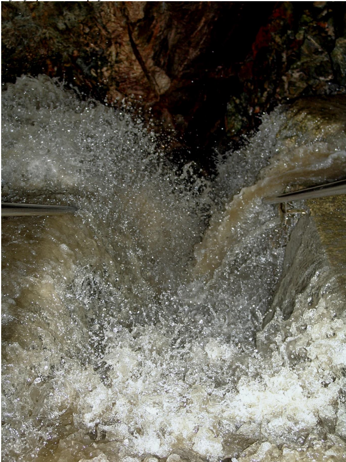
Punkevní jeskyně – schodiště ze dna propasti Macochy k prvnímu přístavišti (2006)

Z toho jak jsem viděl pracovat profesionální skupinu pod vedením Zdeňka Šerebla jsem měl dne 4. a 5. 9. 71 velikou radost a jsem jist, že tato skupina v brzké době přijde k velikým úspěchům, k tomu jim již předem blahopřeji!