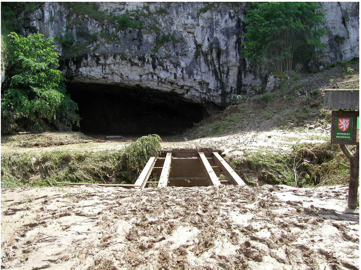
Sloup – stržený most do Sloupsko-šošůvských jeskyní (2003)

Jižní část Moravského krasu je odvodňována Ochozským, Hádeckým a Hostěnickým potokem. Povodí má plochu 76 km 2 s průměrným ročním průtokem 0,16 m 3 .s -1 . Největším jeskynním systémem je Ochozská jeskyně, jejíž známá část je tvořena povodňovým patrem Hostěnického potoka. Aktivní podzemní tok je kromě vývěrů zastížen pouze ve spodním patře jeskyně Netopýrky. Ponorné toky po průtoku velmi složitou hydrografickou sítí vyvěrají jako potok Říčka ve dvou vývěrech.