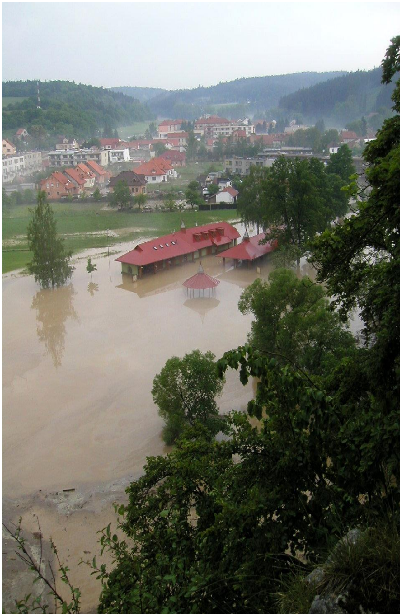
Sloup – zatopený vstupní areál sloupsko-šošůvských jeskyní (2003)