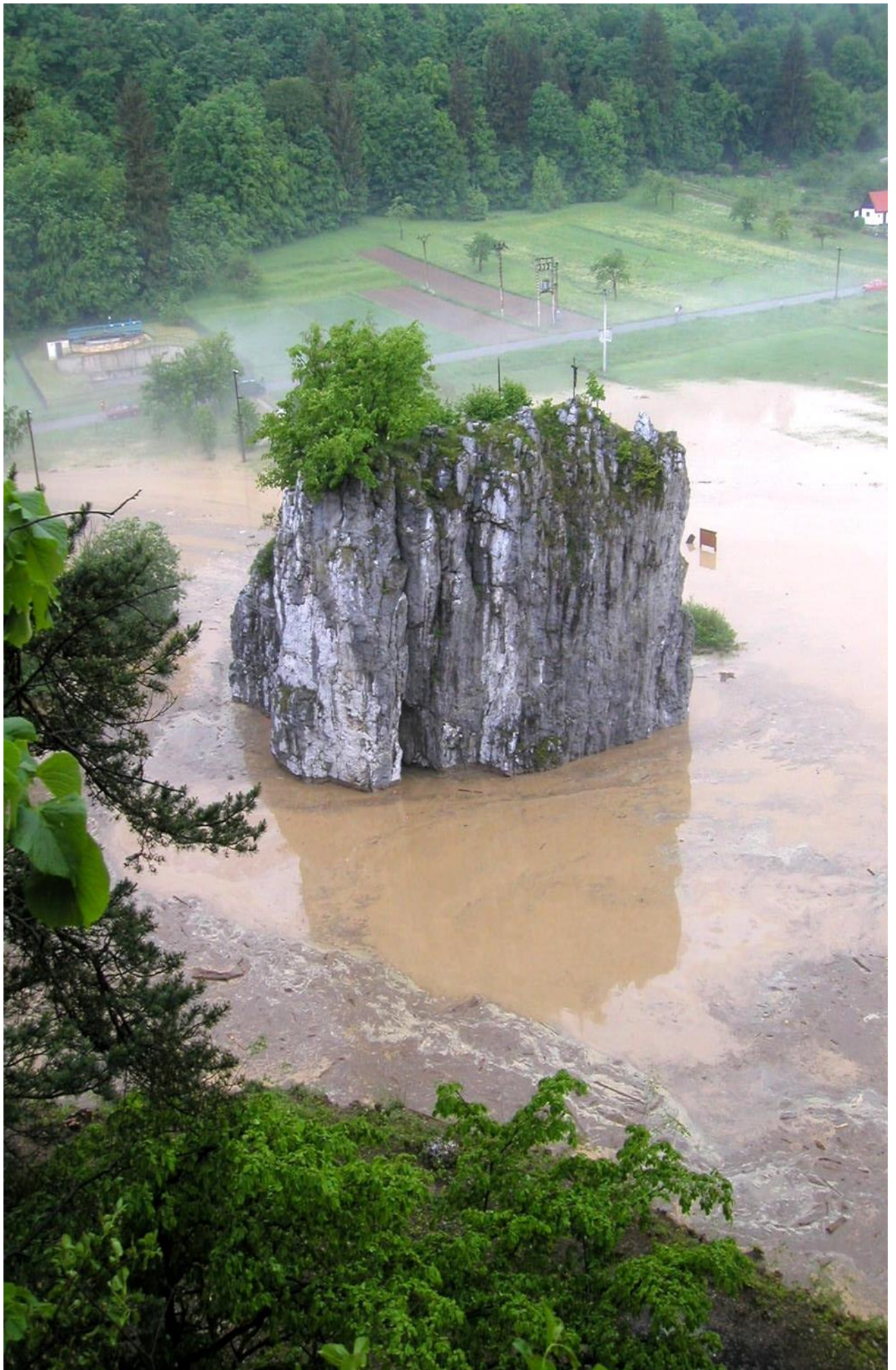
Hřebenáč – Sloupský potok dále pokračuje v cestě Pustým žlebem k Punkevním jeskyním. (2003)